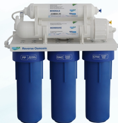
Stație osmoză inversă cu mineralizare