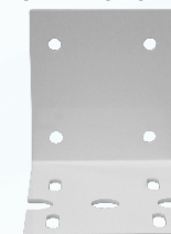
Șurub suport carcasă filtru BB 20"