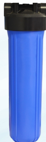
Filtru BigBlue (BB) 20"