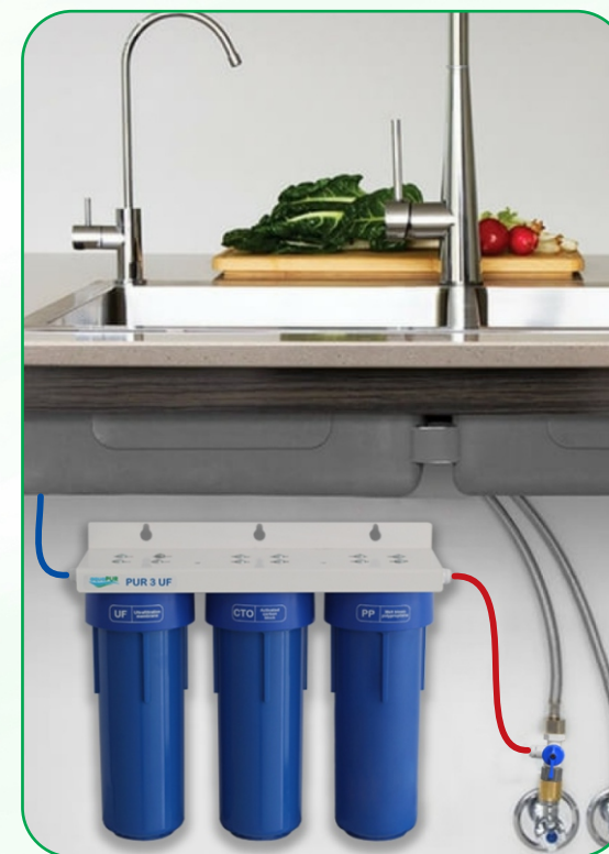
* Schema montaj sistem de filtrare la punctul de consum

Provenită de la rețelele învechite și de la intervențiile pentru diverse reparații