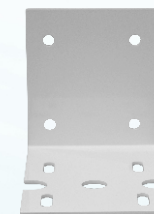
Șurub suport carcasă filtru BB 20" (cod: 87144010103)