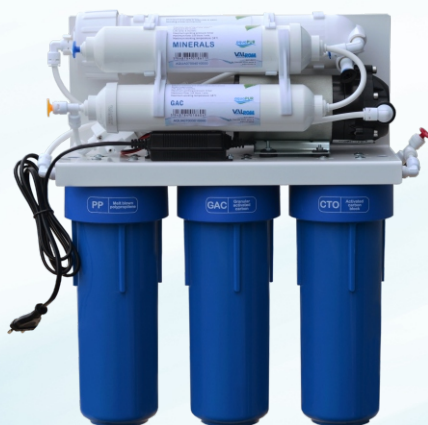
Stație osmoză inversă cu mineralizare și pompă