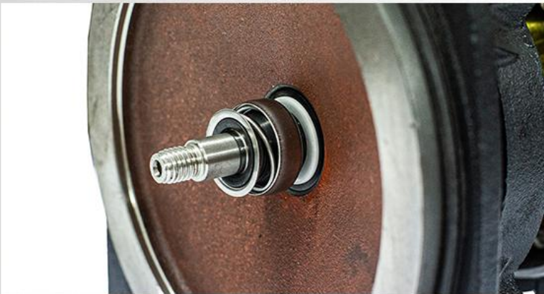
Garnitura mecanică: ceramică/grafit/NBR