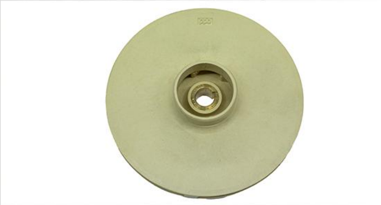
Turbina din PPO(techno-polymer)