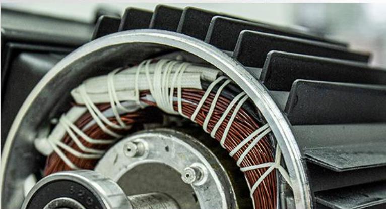
Carcasa motorului din aliaj de aluminiu